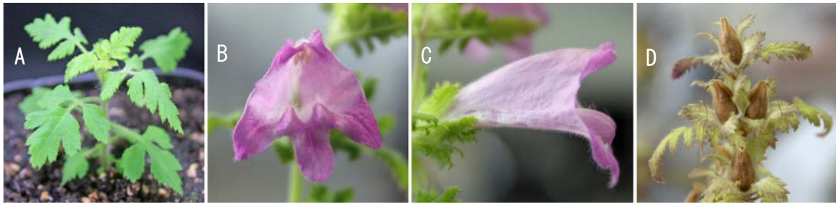
図2 コシオガマ ( Phtheirospermum japonicum ) (A)植物体, (B)(C)花, (D)果実

私たちの研究グループではコシオガマをハマウツボ科寄生植物の吸器研究のモデル植物としている (図2)。コシオガマはハマウツボ科コシオガマ属の条件的半寄生植物で、東アジアに自生する。日本国内でも見つけることができ、花の色の異なるエコタイプも観察されている。コシオガマは自家受粉をする短日植物で、人工気象器の中で容易に栽培することができ、約3ヶ月で次世代の種子が得られる。人工的に交配させる方法も確立しており、遺伝学に適している。私たちの研究グループでは、岡山県で採取されたコシオガマを研究室環境で数世代自殖させ、野生型として研究に使用している。この野生型をもとに、EMSを変異原としたスクリーニングから、吸器にさまざまな表現型を示す変異体の単離にも成功している (Cui et al., 2016)。当研究グループではゲノムの解析も進んでおり、ゲノムリシーケンスによる変異体原因遺伝子の同定も可能となっている。また、 Agrobacterium rhizogenes を用いた形質転換法を確立しており、誘導された毛状根を用いた分子生物学的解析をともなった寄生実験も可能である (Ishida et al., 2011)。コシオガマは T. versicolor と同様に、幅広い植物種を宿主とすることができる。これまでのところ、シロイヌナズナ、イネ、ソルガム、トマト、ササゲ豆に寄生できるが、ミヤコグサとダイズには寄生できないことを確認している。吸器の発生過程は、先行研究のあるハマウツボ科条件的半寄生植物である A. purpurea や T. versicolor とほとんど同じである。宿主植物、またはDMBQなどのHIFを用いて in vitro で吸器の誘導ができる (図3)。